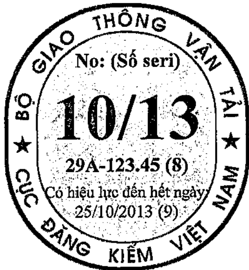
Tem kiểm định cho xe cơ giới